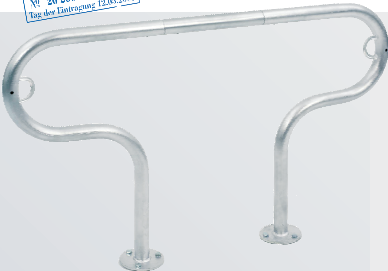
Modell LOOP 31 Model LOOP 31

DPMA GEBRAUCHSMUSTER № 20 2005 003 489.4 Tag der Eintragung 12.05.2005