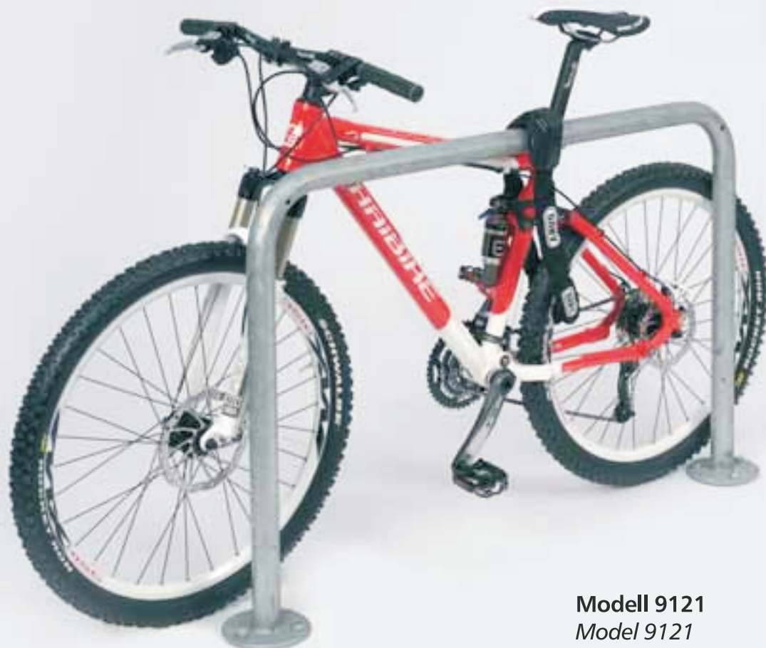
Modell 9121 Model 9121