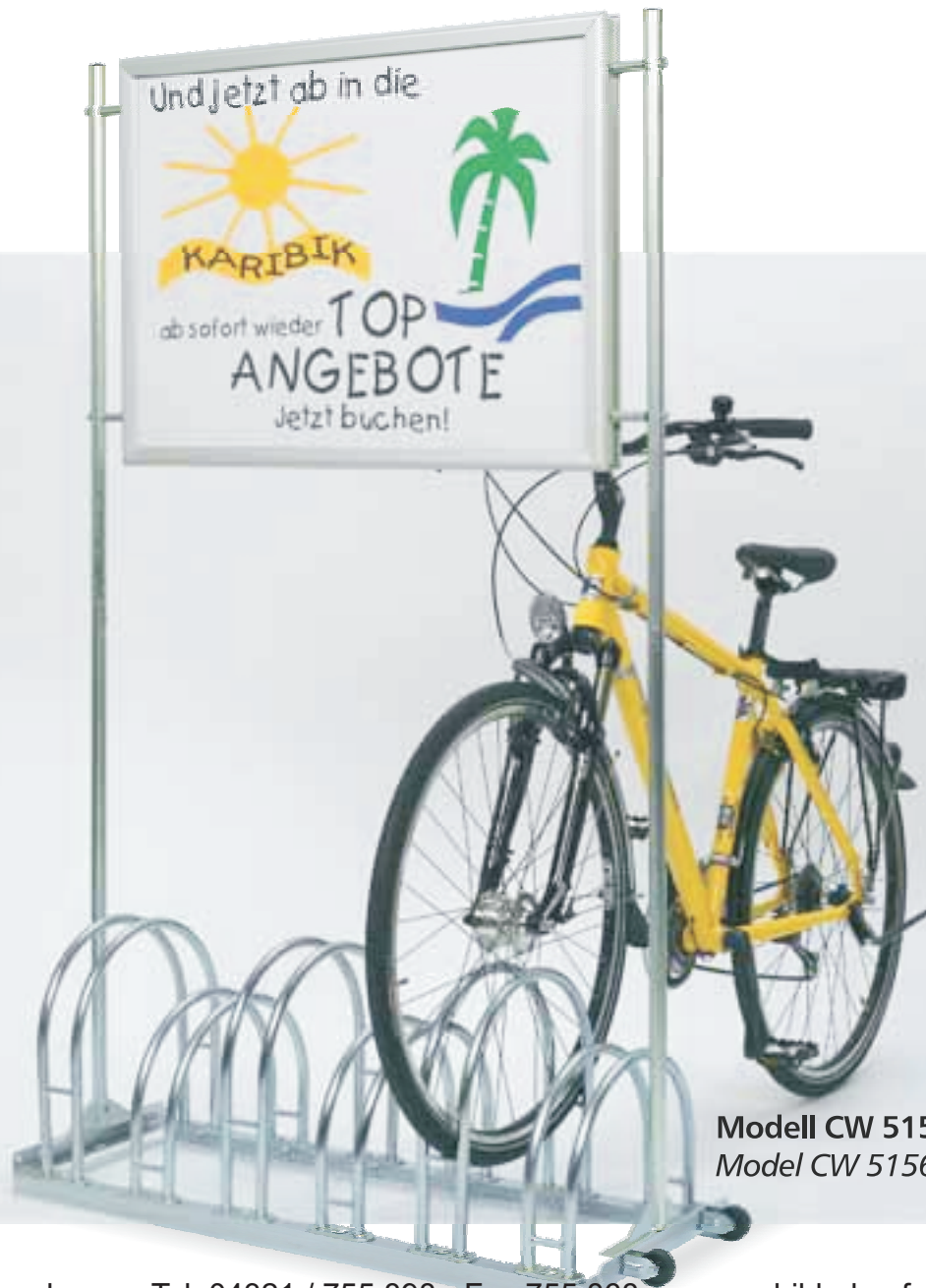
Modell CW 5156 Model CW 5156