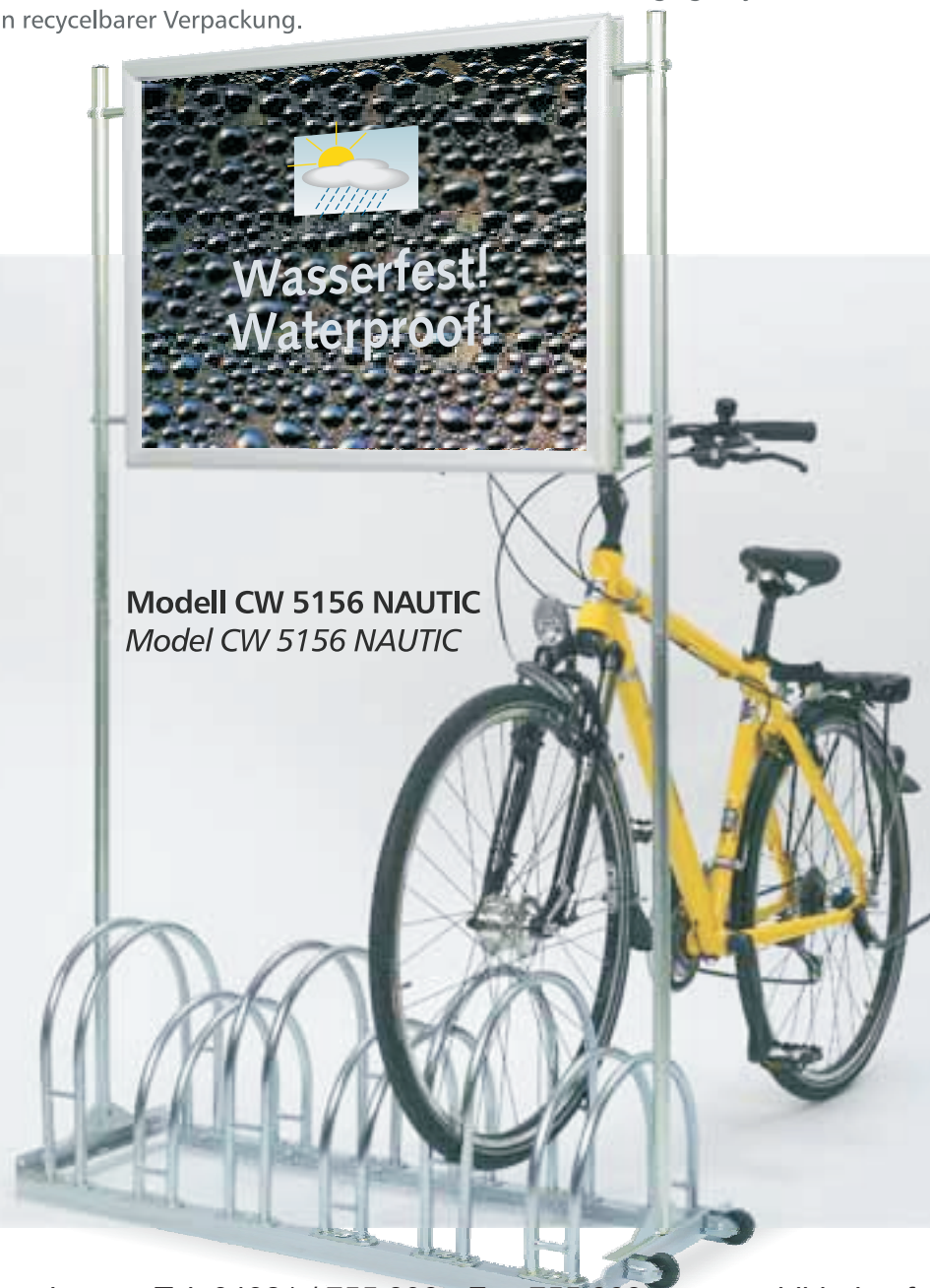
Modell CW 5156 NAUTIC Model CW 5156 NAUTIC