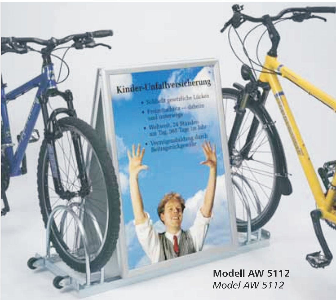
Modell AW 5112 Model AW 5112