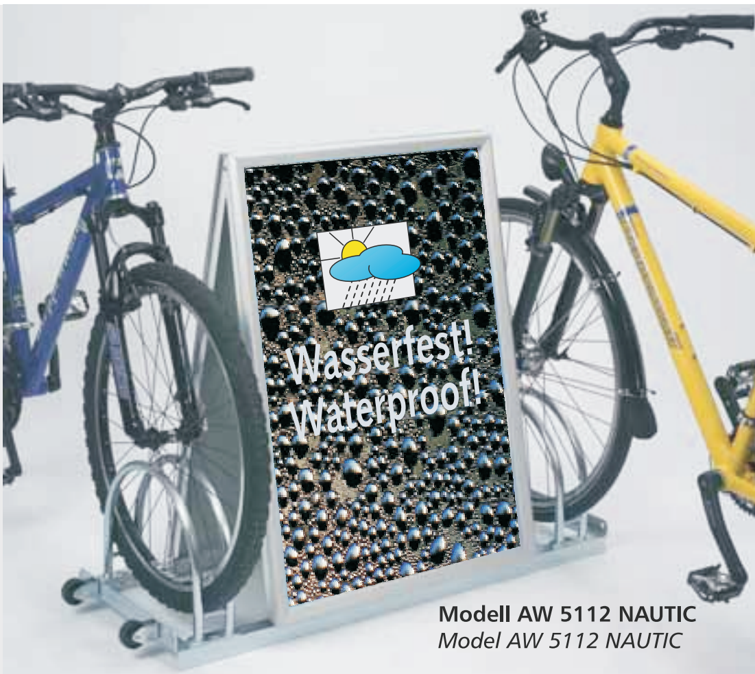
Modell AW 5112 NAUTIC Model AW 5112 NAUTIC