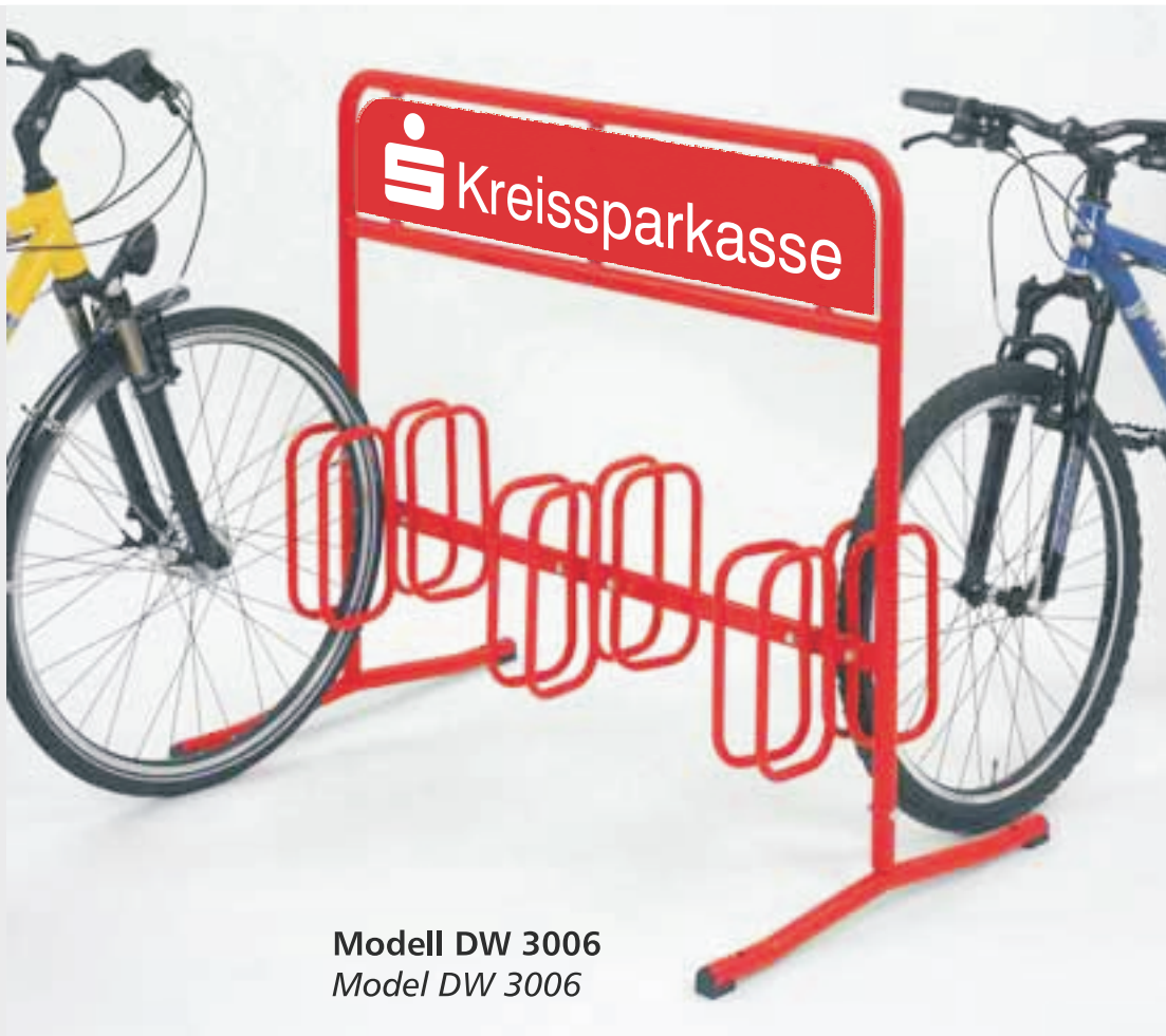
Modell DW 3006 Model DW 3006