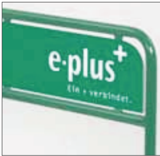
Pulverbeschichtet RAL nach Wunsch. Powder coated RAL on request.